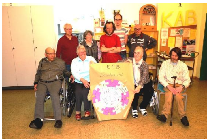
Unsere Beteiligung MISEREOR-Fastrenaktion 2018

Datum: 13.04.2019 Zeit: 14.30 Uhr - 17.30 Uhr Referenten: Vorstand KAB Driescher Hof